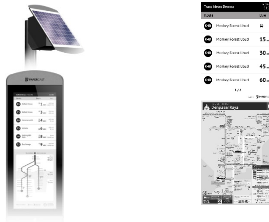
図 2 左画像：試験的に使用する大型ディスプレイ（デジタルサイネージ）

具体的実施内容：Papercast 社が開発し、地元コミュニティのニーズを考慮してカスタマイズされた大型のバススケジュールのディスプレイに、バリ島の公共路線バス「トランスメトロデワタ」のバス到着予想時刻を表示します。バスの時刻表、地図、その他のスポット広告を表示することで乗客の利便性と効率性を向上させ、公共バスの利用率を高めるように設計しました。これにより、「SMART Shuttle @ウブド」への乗り継ぎが容易になり、お客様がより効率良く移動を計画することが可能になります。