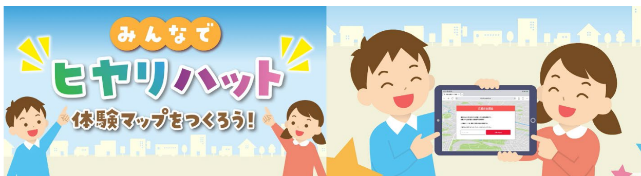
身近な危険箇所を可視化できるヒヤリハットマップシステム

単に特定の交差点での注意点を学ぶだけでなく、交通の流れ、道路構造などから危険を予測する力を育むことで、場所が変わっても応用できる視点の習得を目指します。