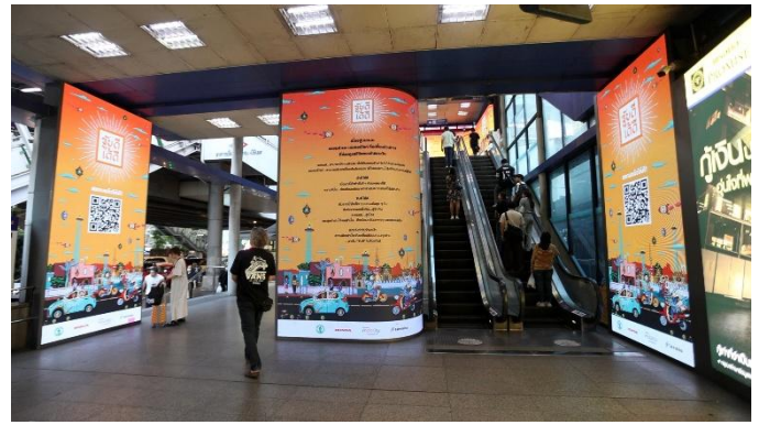
第1フェーズの 屋外広告の様子

こうした結果を踏まえ、第2フェーズでは、1年のうちでも交通事故が多発する時期であるソンクランに合わせ、特に飲酒運転防止を重点テーマの一つとしてメッセージを発信します。加えて、LINE 公式アカウントを新たなコミュニケーション基盤として活用し、交通安全に関するコンテンツの配信や、継続参加を促す仕組みを導入します。参加者は、日次で更新される交通安全コンテンツに触れることで、ポイントを貯めながら楽しんで学ぶことができます。こうした継続的な接点を通じて、交通安全への理解を深め、日々の行動を見直すきっかけづくりを目指します。