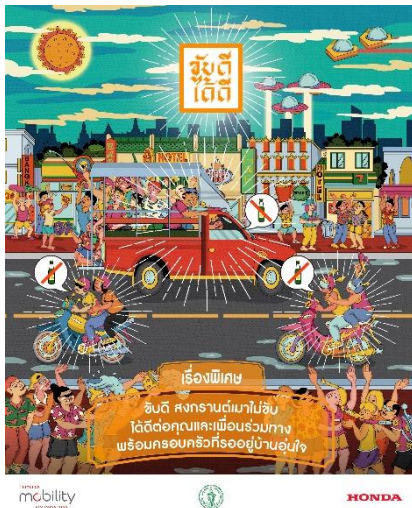
ソンクラン向けキービジュアル

こうした結果を踏まえ、第2フェーズでは、1年のうちでも交通事故が多発する時期であるソンクランに合わせ、特に飲酒運転防止を重点テーマの一つとしてメッセージを発信します。加えて、LINE 公式アカウントを新たなコミュニケーション基盤として活用し、交通安全に関するコンテンツの配信や、継続参加を促す仕組みを導入します。参加者は、日次で更新される交通安全コンテンツに触れることで、ポイントを貯めながら楽しんで学ぶことができます。こうした継続的な接点を通じて、交通安全への理解を深め、日々の行動を見直すきっかけづくりを目指します。