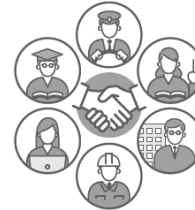
多様なステークホルダーとの協働