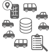
多角的なデータ分析