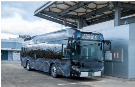
伊都キャンパス周辺で運行する大型水素燃料電池バス